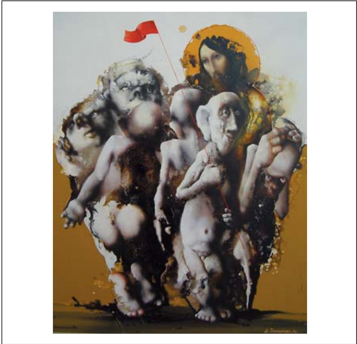
Slava Zaharinski "VARISERID", õli, lõuend, 1989 Slava Zakharinsky PHARISEE, oil on canvas, 1989