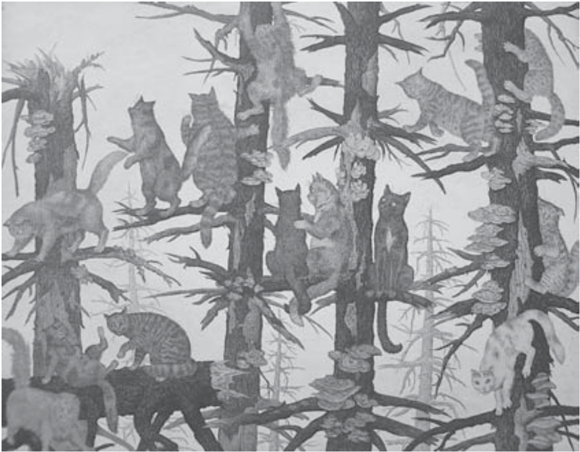
Valeri Slauk "KASSID", ofort, 2002 Valeri Slauk CATS, etching, 2002