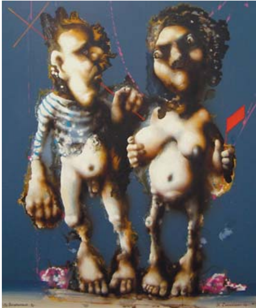
Slava Zaharinski "VARISERID", õli, lõuend, 1989 Slava Zakharinsky PHARISEE, oil on canvas, 1989