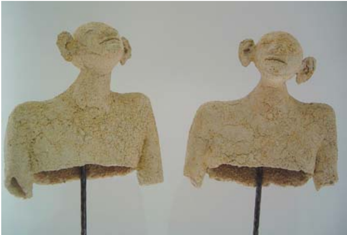
Kauri Kallas "VALGUSE VALVURID", savi, metall, 2006 Kauri Kallas THE GUARDS OF LIGHT, clay, metal, 2006