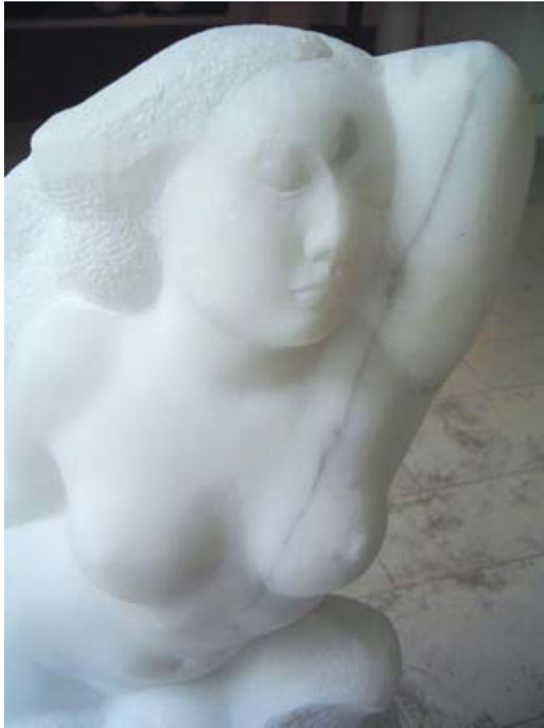
Ellen Kolk "MEREVAHUST SÜNDINU", carrara marmor, 2006 Ellen Kolk BORN OF SEA FOAM, Carrara marble, 2006