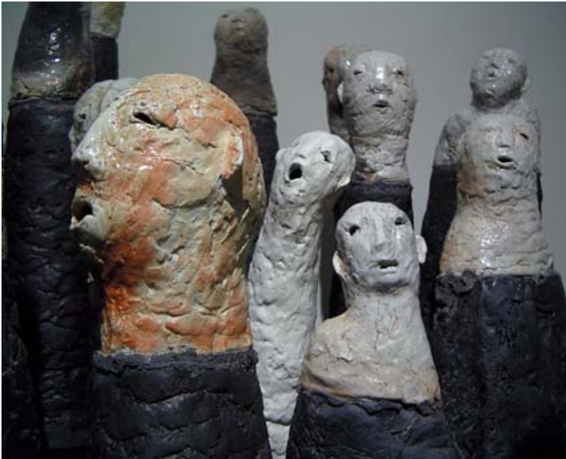
Betty Engholm "BOSNIALASTE PORTREEGRUPP: MÖTLEMINE, RÄÄKIMINE JA DISKUSSIOON TULEVIKUST", savi, portselan, 2002 Betty Engholm THE PORTRAIT GROUP OF BOSNIANS: THINKING, TALKING AND DISCUSSION ABOUT THE FUTURE, clay and porcelain, 2002