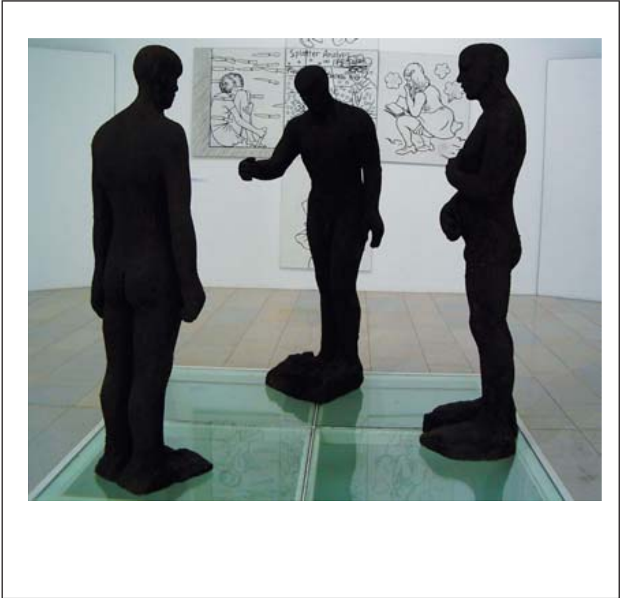
Kirke Kangro "MULLAMEHED", segatehnika, 2006 Kirke Kangro EARTHEN MEN , mixed technics, 2006