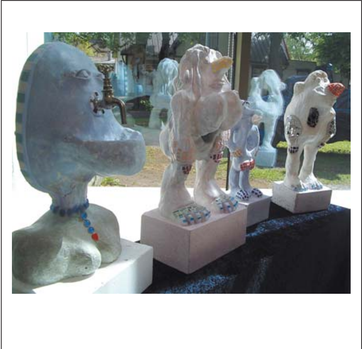
Emma Asplundi ja Magnus Östlingi betoonfiguurid Rootsi kunstistuudiost INUTI. Figures by Emma Asplund and Magnus Östling from the Swedish art studio INUTI.