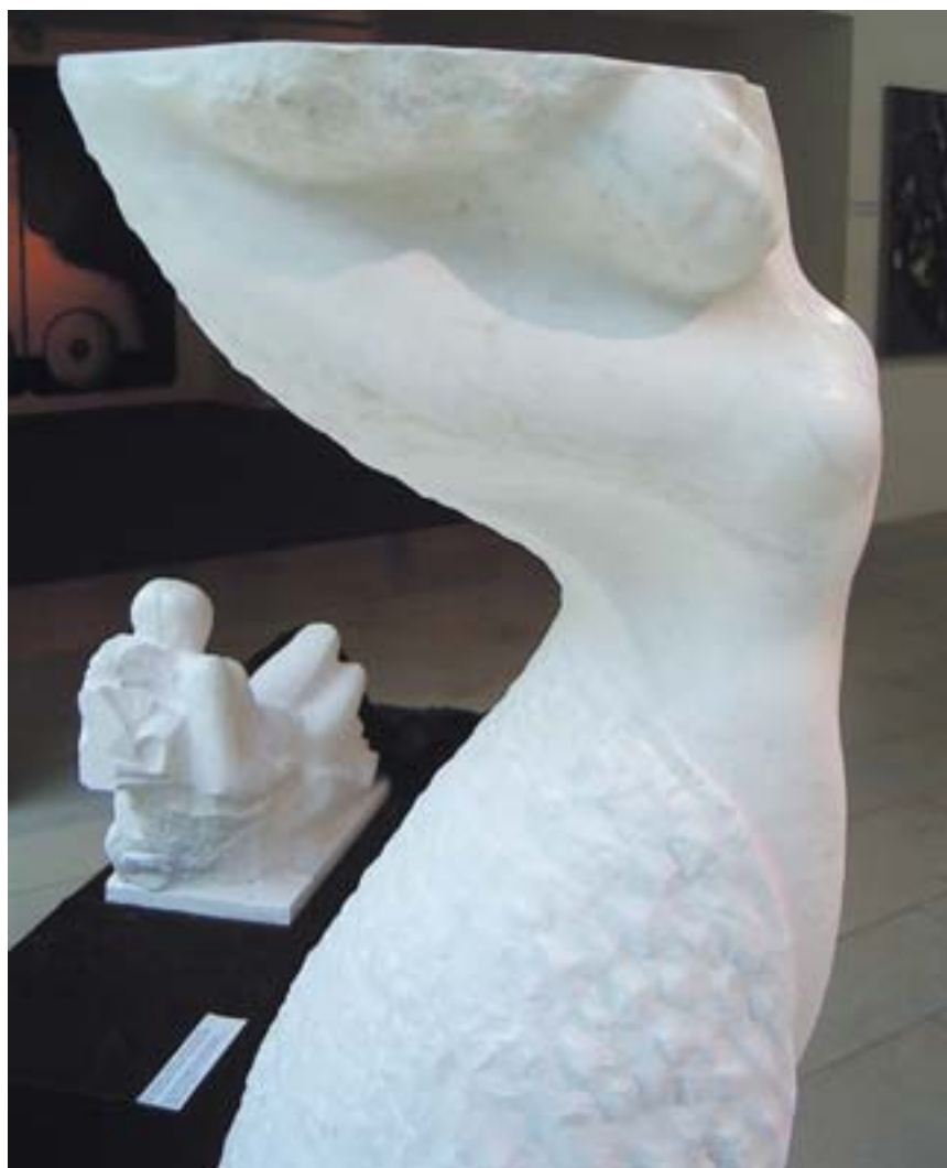
Ilme Kuld "LAINÉ", carrara marmor, 2006 Ilme Kuld A WAVE, Carrara marble, 2006