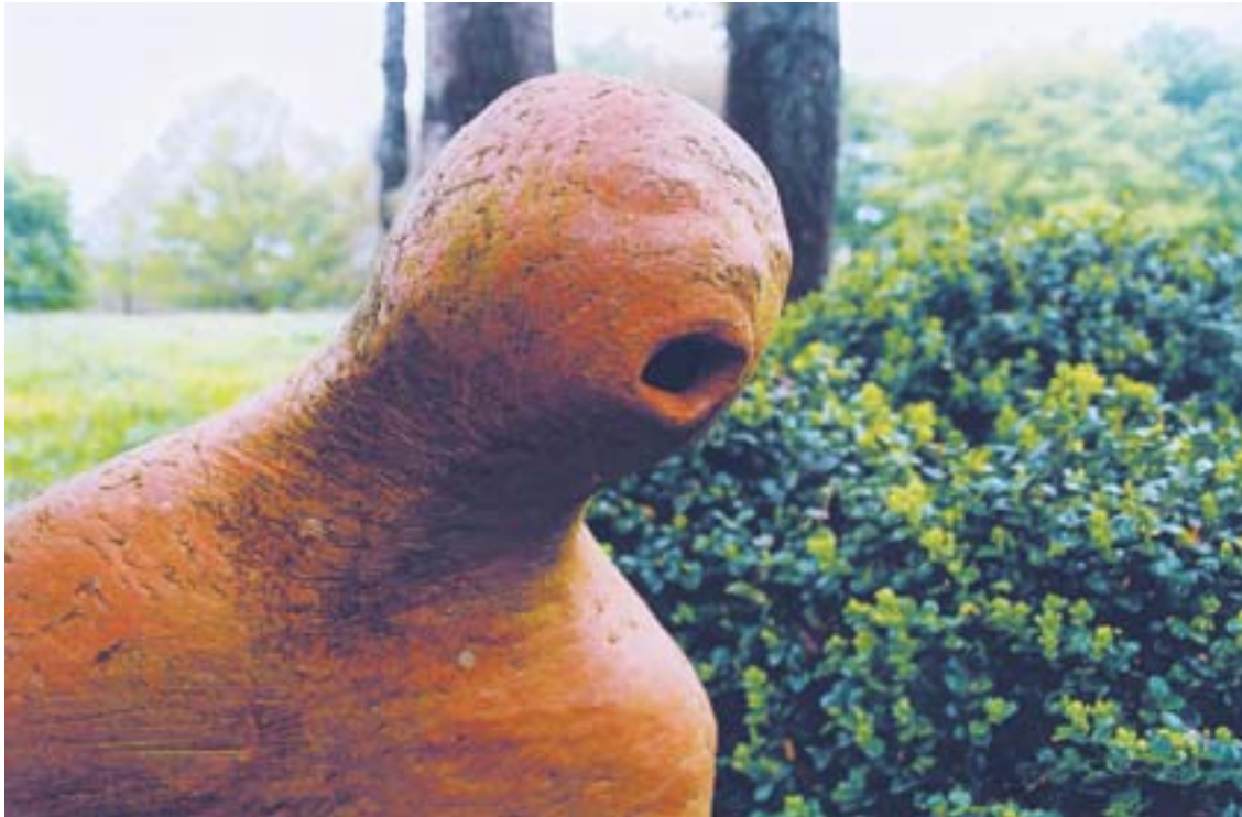
Betty Engholmi üks paljudest kujudest tema kunstitalus. One of the many sculptures at Betty Engholm's art farm.