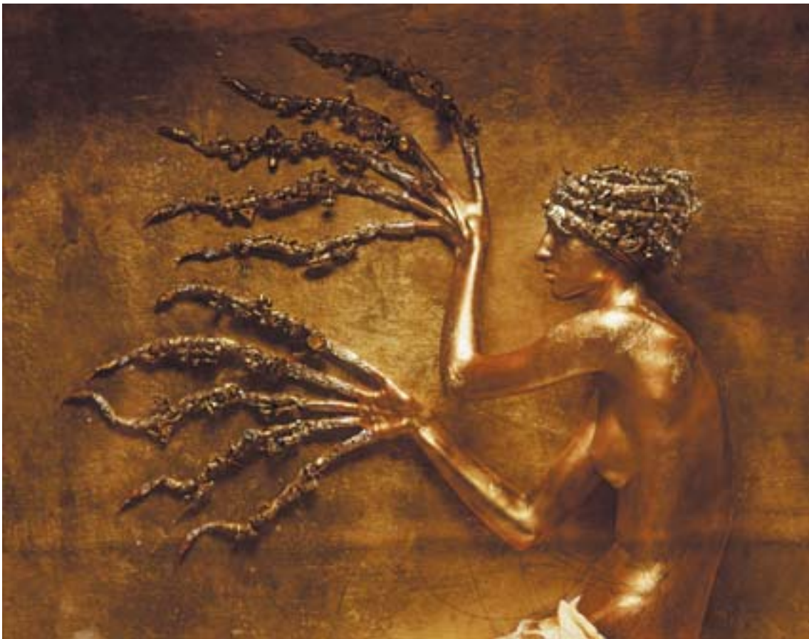
Andrei Chchukin "ORBIS TERTIUS #5", foto Andrei Chchukin ORBIS TERTIUS #5, photo