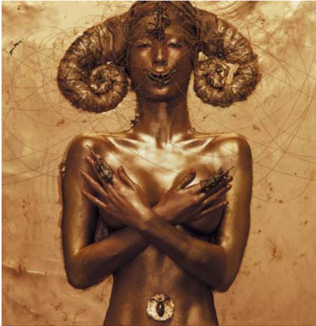
Andrei Chchukin "ORBIS TERTIUS #7", foto Andrei Chchukin ORBIS TERTIUS #7, photo